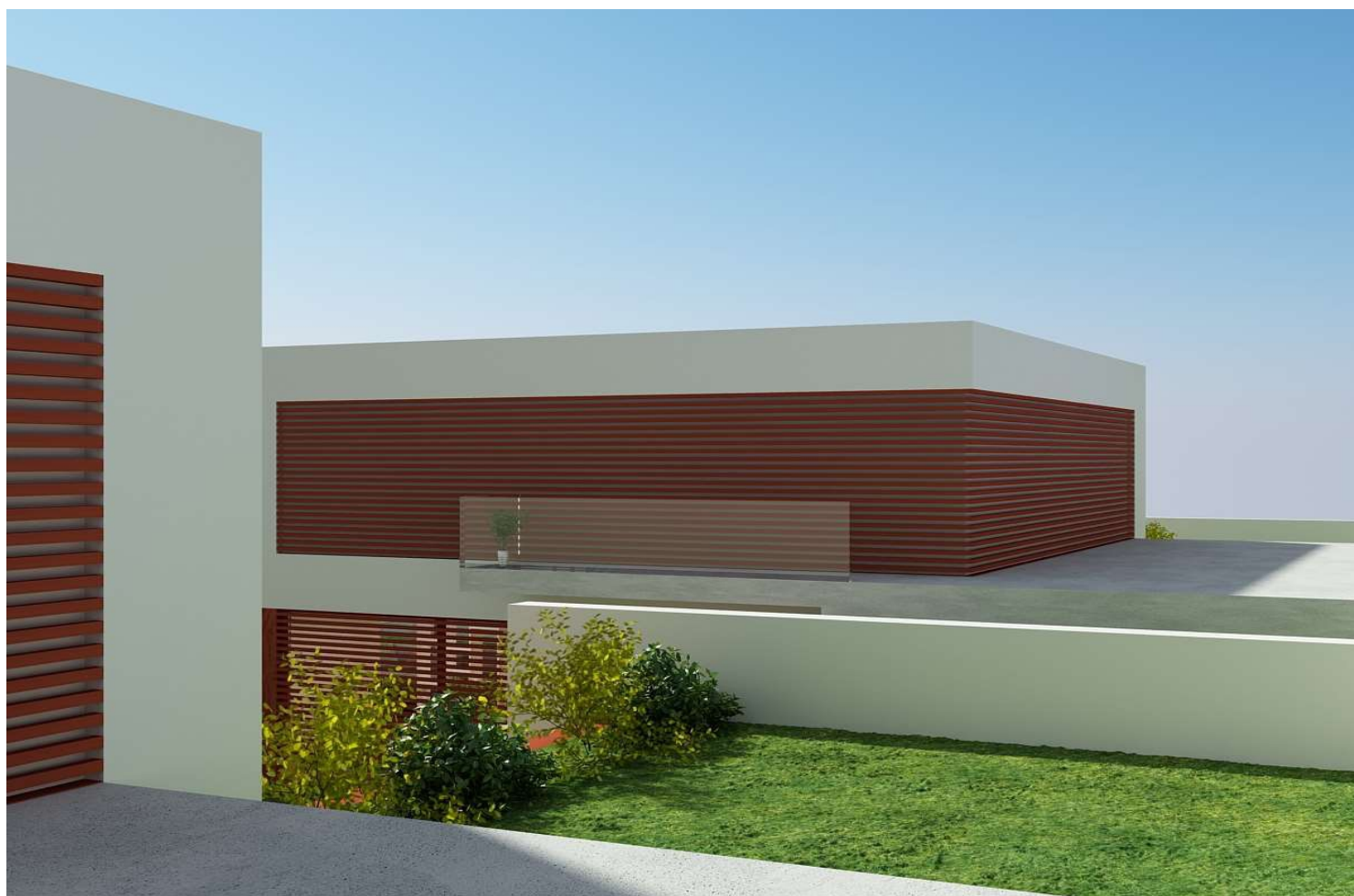
ZONA DE ENTRADA