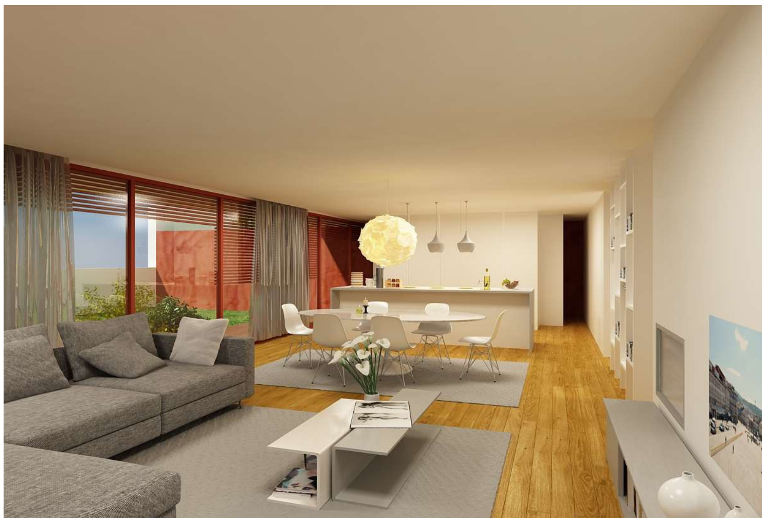
SALA DE ESTAR E JANTAR